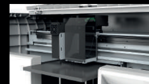
CABEZAL EPSON i3200