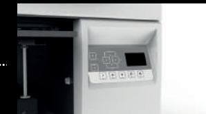
PANEL DE CONTROL MULTIFUNCION CON INTERFAZ INTUITIVA.