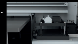
MESA CON SUCCIÓN 297x420mm