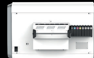
TINTA CMYK + W+B RECIRCULACION AUTOMATICA Y AVISO DE ESCASEZ DE TINTA

TECNOLOGÍA UV QUE PERMITE IMPRIMIR SOBRE UNA GRAN CANTIDAD DE MATERIALES RÍGIDOS Y NO RÍGIDOS