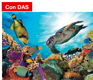
La posición de caída de gota correcta y la alimentación de papel garantiza mejor calidad de impresión