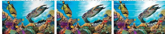
Posición de caída de gota bidireccional incorrecta Superposición / rayas negras (Alimentación de papel insuficiente) Espacio / rayas blancas (Alimentación de papel excesivo)

* DAS puede no ser compatible con algunos soportes como a color, transparente y sustratos en relieve.