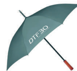
Paraguas de Nylon