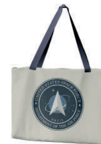
Bolsa de Tela