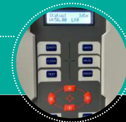
Panel de control

El acabado final es de un tacto suave superior al vinilo textil. Es extraordinariamente elástico y resistente, lo que nos permite estirar la prenda sin que ésta cuartee.