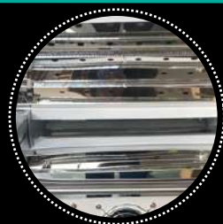
Horno de curado

La tecnología de impresión DTF nos permite imprimir cuatricomías, sin necesidad de crear una pantalla por color. También nos da la posibilidad de realizar degradados. La TexTek FD-65 nos permite imprimir en DTF a velocidades de vértigo, hasta 13m lineales hora en configuración de CMYK+W