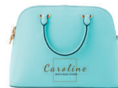
Bolso de Piel