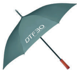
Paraguas de Nylon