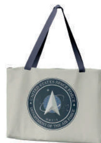
Bolsa de Tela