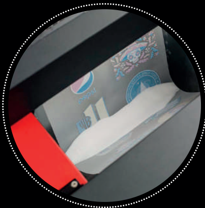
Aplicación del adhesivo

Esta nueva tecnología de impresión nos permite tanto imprimir cuatricomías, sin necesidad de crear una pantalla por color, cómo degradados con facilidad manteniendo una alta producción autónoma, sin la necesidad de que un operario tenga que cortar o pelar vinilos previamente a su aplicación.