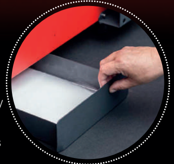
Bandeja de recogida

El tren de trabajo se compone de un desbobinador, una impresora de 33cm de ancho de entrada de material y un horno de secado con rebobinador. Gracias a este último, podemos aplicar fácilmente la cola en polvo y curando el material antes de volver a rebobinar el material impreso, con lo que podremos imprimir hasta 100 metros lineales sin preocupación de ir cambiando hojas unitarias ni aplicar el acabado manualmente.