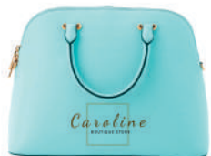
Bolso de Piel

La OASIS DTF30 se ha convertido en una herramienta indispensable en el mundo de la personalización. ”