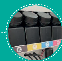
Depósito de tintas CMYK + W + V

El proceso consiste en imprimir en una impresora DTF UV sobre un soporte con un pegamento especial (Film A), que luego se expone a la luz UV.