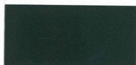
073 ~RAL 7043 ~HKS 92 Dark grey Dunkelgrau Gris foncé