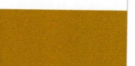
092 Copper Kupfer Cuivré