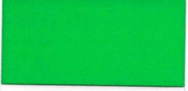
068 ~HKS 57 Grass green Grasgrün Herbe