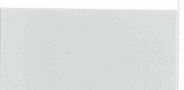
072 ~RAL 7035 Light grey Hellgrau Gris clair