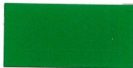
613 Forest green Waldgrün Vert forêt