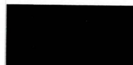
070 ~RAL 9005 ~HKS 88 Black Schwarz Noir