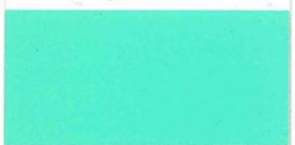
055 Mint Mint Menthe