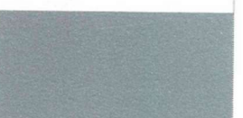
090 ~RAL 9006 Silver grey Silbergrau Gris argent