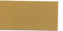
081 Light brown Hellbraun Brun clair