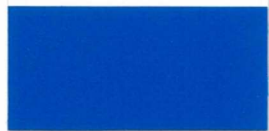
098 ~HKS 44 Gentian Enzian Gentiane