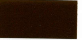
080 Brown Braun Brun