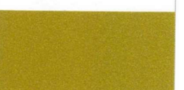
091 Gold Gold Or