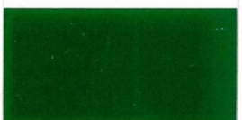
060 ~RAL 6005 Dark green Dunkelgrün Vert foncé