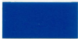
051 ~HKS 44 Gentian blue Enzianblau Bleu gentiane